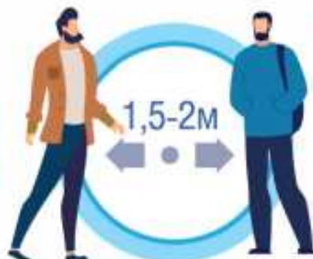
СОБЛЮДАЙТЕ РАССТОЯНИЕ И ЭТИКЕТ